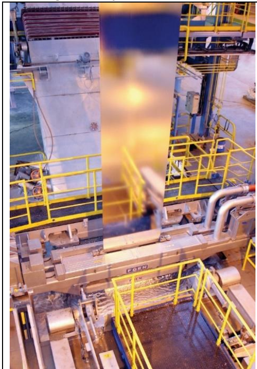
Figura 1 - Linha de galvanização contínua da ArcelorMittal Vega